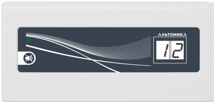
Рис. 1 Внешний вид приемника

Приемник выполнен в пластмассовом корпусе, на передней панели которого расположены двухразрядный семисегментный светодиодный цифровой индикатор и кнопка «Сброс тревоги».